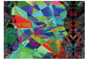
エンライトメント

美術家。1960年、大阪府生まれ。1984年、京都市立芸術大学大学院美術研究科修了。1982年代より、インスタレーション、映像、写真、素描などの手法を用いて、空間を愛する作品を国内外で発表。大阪在住。