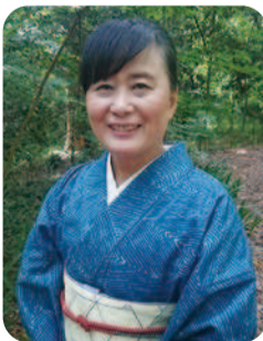
俳人 夏井いつき(愛南町出身)