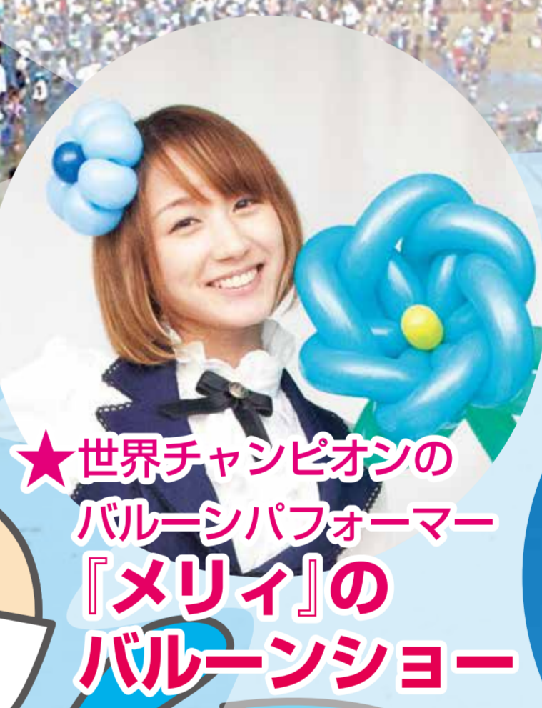
★世界チャンピオンの バルーンパフォーマー 「メリィ」の バルーンショー

夜の部 ステージイベント 17:30~20:30 ★カラオケコンテスト ★かみうら海道夢太鼓