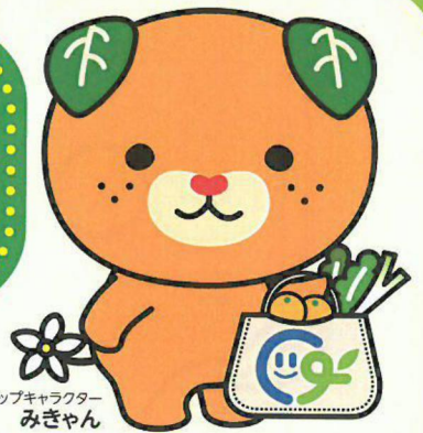
愛媛県イメージアップキャラクター みぎゃん