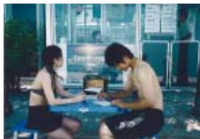
大好評のリクエストコーナー！ メッセージも一緒にいただきます。