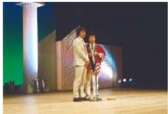
よしもと若手お笑い芸人5組による 「ザ！お笑い！DASH!!」