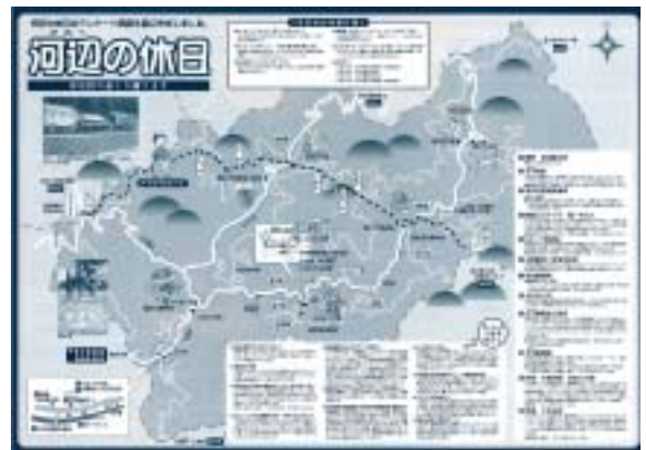
河辺の休日 (A3 サイズ)