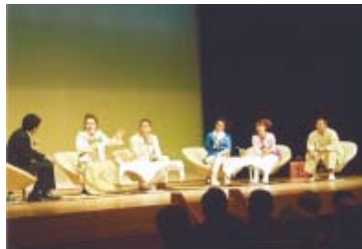
大助・花子さん、さゆみ・ひかりさんによる 家族のお話