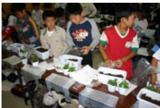
子供たちの園芸体験会