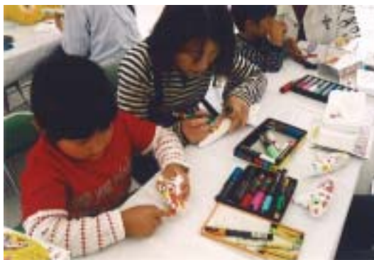
オカリナを作ろう！教室

子供たちからお母さん、お父さん、おばあちゃん、おじいちゃんまで、 家族みんなが楽しめるイベント として、「体験工作教室」があります。 例えば「 オカリナを作ろう！教室 」、「 タオルハンガーを作ろう！教室 」では、 親子で絵付けを会話と共に楽しんで、一緒に作品を仕上げることにより、 家族の絆がいっそう深まると、とても好評を得ています。 教室では、 専門インストラクターが丁寧にわかりやすく指導 しますので、 安心して参加いただけます。