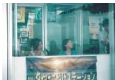
ふたみシーサイド公園内の 特設 DJ ブースから ON AIR