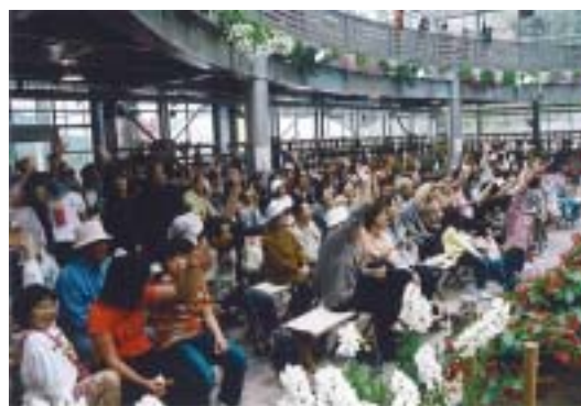
寄せ植えコンテストやお楽しみ抽選会もあり、 来場者全員が参加できるイベントです。