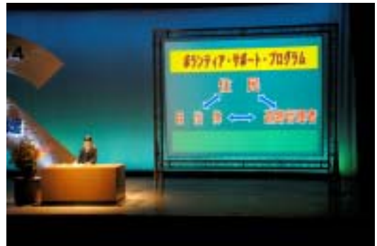
活動内容の発表と 意見交換