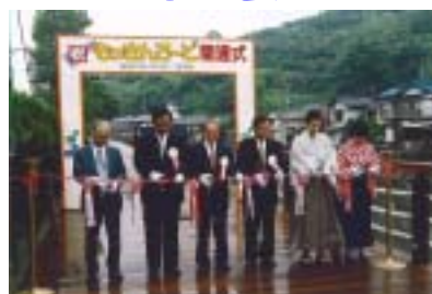
開通式でのテープカット