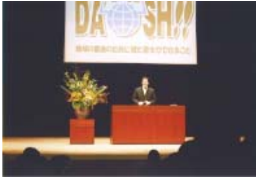
松山市長による 主催者挨拶

このイベントにおいても事務局として、 イベント告知、入場希望者の募集、入場整理券の発行、 イベントの企画構成運営 などを執り行いました。