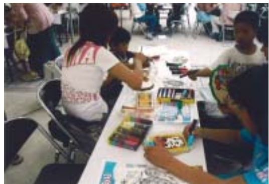
タオルハンガーを作ろう！教室