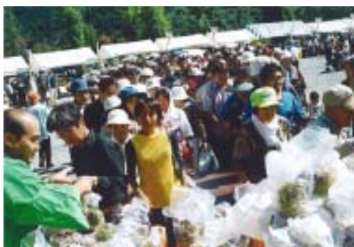
「中山栗」プレゼントコーナーにはたくさんの人が並びます。

中山町の特産品「 中山栗 」の イメージアップを図ろう と始まったイベントです。「栗拾い大会」「栗むぎ大会」「栗果実品評会」など「中山栗」のPRコーナーはもちろん、キャラクターショー、歌謡ショー、ふるさと市も実施し、 町内外から延べ一万人 が訪れます。ふるさと市には中山町特産品がずらりと並び、イベント開始から終了まで、行列がとぎれることはありません。