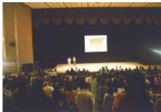
環境クイズ大会 会場の様子