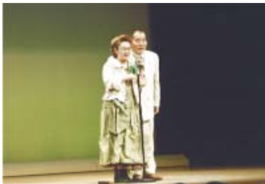
宮川大助・花子さんの夫婦漫才