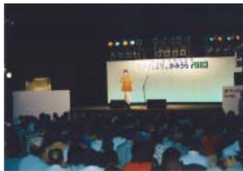
夜は野外ステージで いろいろなアトラクション