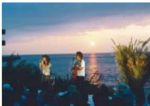
コンサートの主役は、伊予灘の自然と夕日です。