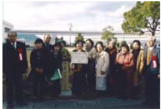
句碑除幕式終了後の 記念撮影