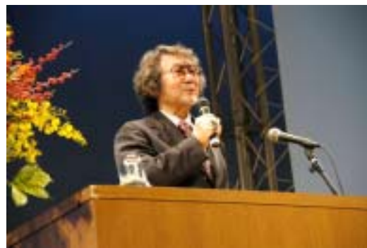
基調講演 映画作家 大林宣彦氏