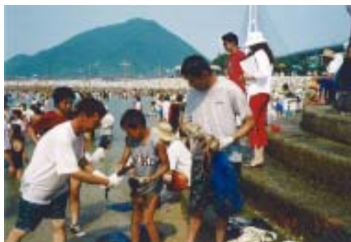
昼間のメインイベント 立て干し網

昼は、約6000匹の魚を放流する立て干し網をメインに、 シーサイド市、釣り堀、シーカヤック教室などで上浦町の海を楽しんだあと、 夕方から夜にかけては、野外ステージでの 郷土芸能ショー、キャラクターショー、歌謡ショー、花火大会などもりだくさんの内容です。