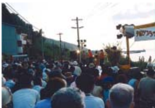
無人駅である JR 下灘駅が、この日はたくさんの人達で賑わいます。

全国でも例を見ない プラットホームをステージ にしたコンサートでは、音楽と瀬戸内海の自然との融合を楽しむことができ、毎年たくさんの人達が訪れています。この「 夕日 」が 主役のコンサート は 双海町の代表的イベント となり、2004年で19回を数えました。 (第2回から現在までプロデュースを担当しています。)