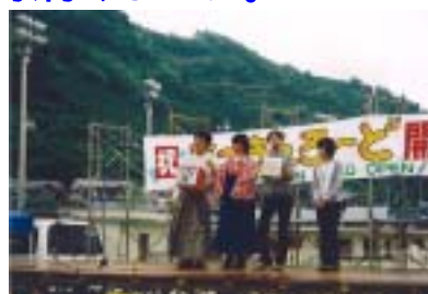
特設ステージでは、 様々なイベントが行われました。