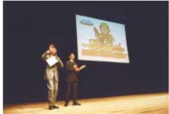
全員参加の 環境クイズ大会