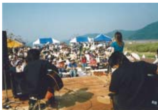
佐田岬メロディーライン ジャンボ風車広場が会場です。

県内外から多数のアマチュアミュージシャンの応募 があり、 選ばれた十数組の熱いメッセージと共に、 佐田岬二市四町(八幡浜市、西予市三瓶町、保内町、伊方町、瀬戸町、三崎町)の 特産品の紹介やバザーなどもあり、 瀬戸内海と宇和海という 「ふたつの海」が存在します佐田岬半島のプロモーションイベント として 存在価値を示しています。