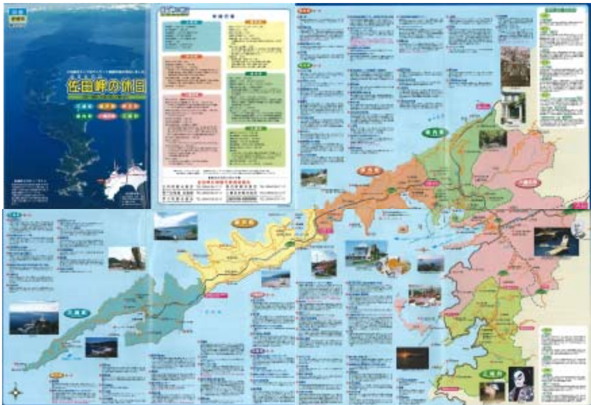
佐田岬の休日 (A1 サイズ)