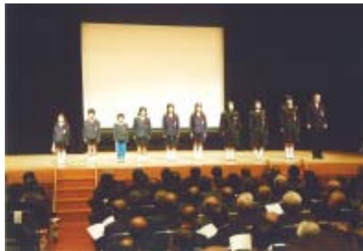
郷土を愛し、家族を想う 誰かへの感謝の作文 優秀作文 表彰及び披露