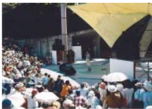
野外音楽広場での人気演歌歌手の歌謡ショー