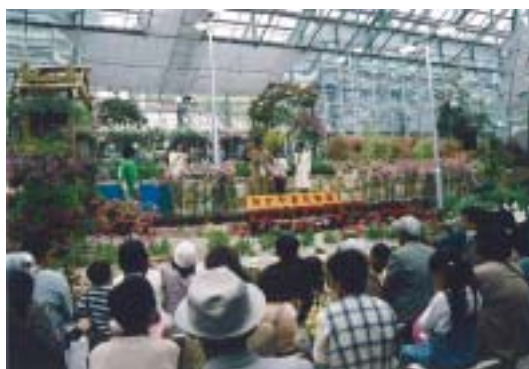
フラワーハウスの中央 花たちに囲まれた特設ステージ

このイベントには中山町民はもとより、 中山町以外からもたくさんの方々に訪れていただき、 館内で花とふれあい、イベントで人とふれあい、 とても温かい思い出を作っていました。